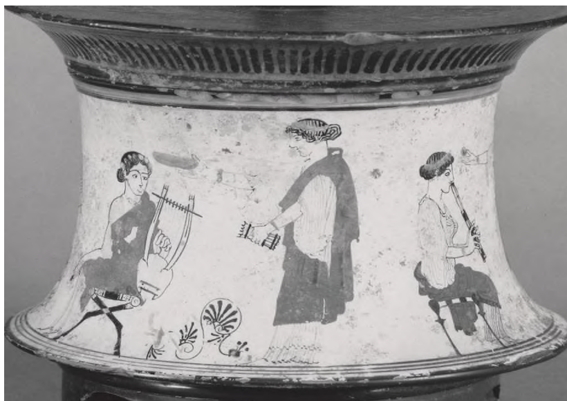
Рис. 3. Музы с музыкальными инструментами. Изображение на краснофигурном пиксисе, около 475–425 гг. до н. э. Музей изящных искусств, Бостон 5

Анализ сведений античных письменных источников – произведений авторов эпической и лирической поэзии, а также сочинений трагиков периода полисной Греции (Hom. Il. XVIII. 525–526; Eur. Rhes. 551–553; Soph. Philoct. 214–215 и пр.) – и вазописи VI–IV вв. до н. э. (BAPD) не оставил сомнений в том, что сиринокс в первую очередь был инструментом пастухов [2, р. 69; 7, р. 141]. Существует две легендарных версии его появления. По первой – сиринокс, как и кифару, изобрел Гермес ( Н.Н. Нумп. 4. 512). По другой – создателем инструмента был Пан [3, с. 319–321]. Мы не станем подробно останавливаться на данных сюжетах, только отметим, что оба персонажа имели непосредственное отношение к пастушеской среде. Чаще всего изготовление сиринокса связывают с Паном, а сам музыкальный инструмент называют флейтой Пана [3, с. 320]. В вазописи также превалируют изображения сиринокса в руках Пана, а не Гермеса 4 . Порой можно найти изображения с музами, которые играют на музыкальных инструментах, в том числе на сириноксе. На краснофигурном пиксисе, датированном примерно 475–425 гг. до н. э., присутствуют музы с такими музыкальными инструментами, как лира, авлос и сиринокс (рис. 3).